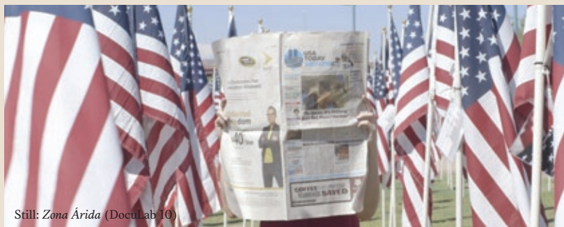
Still: Zona Árida (DocuLab 10)