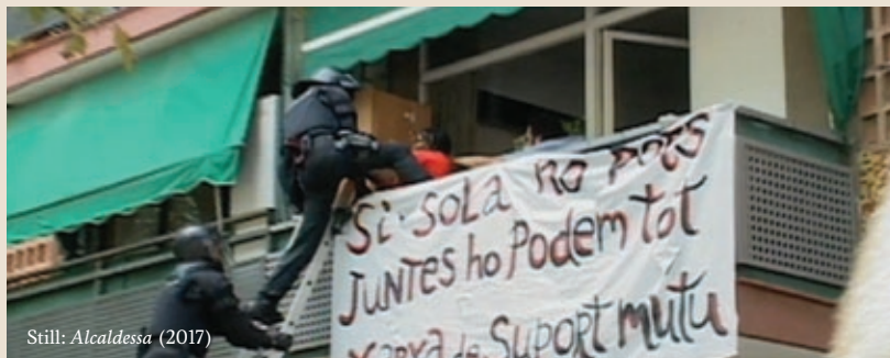
Still: Alcaldessa (2017)